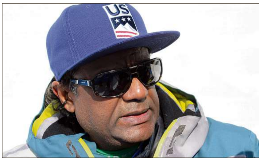
Er caps tradeschan la derivanza dals fans.

tscherna da las chapitschas savess strusch esser pli vasta. Segir portan vegl e giuven savens las chapitschas uffizialas dals Campiadis mundials da skis, dentant blers han lur atgnas chapitschas particularas. Cun quella attiran tuts l'attenziun dals auters fans. Ultra da quai èn lur chapitschas er motivs per fotografar e gist quai avain er nus fatg.