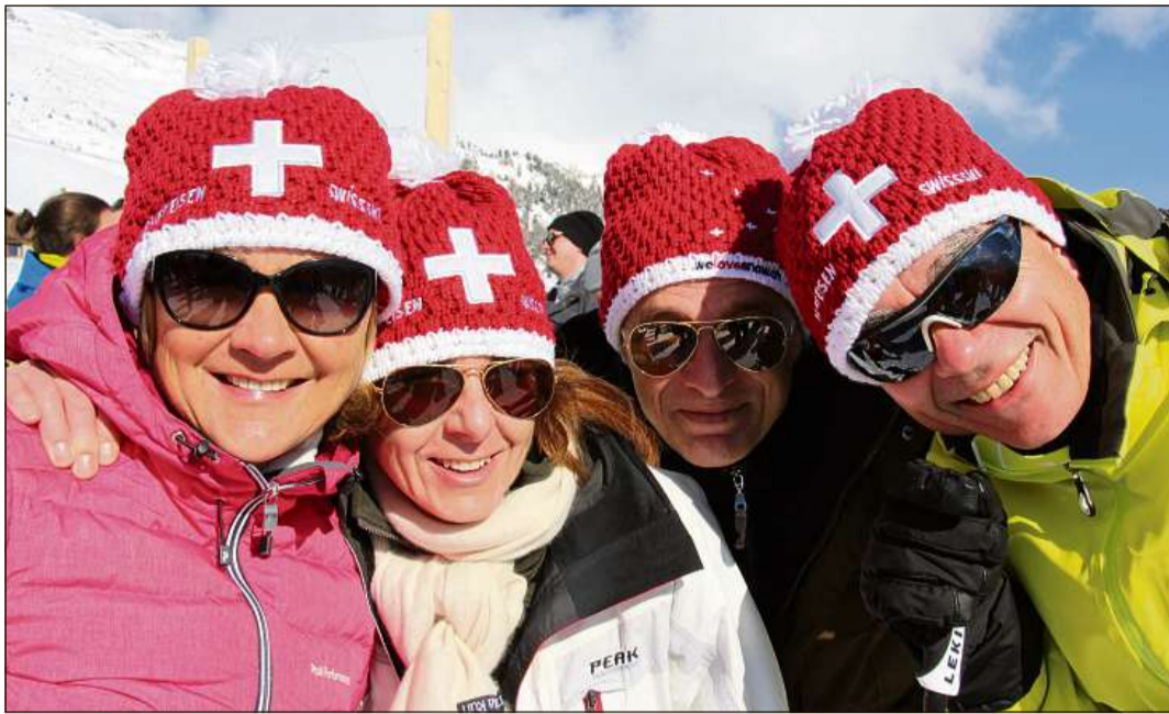
Ina grappa fans svizzers.