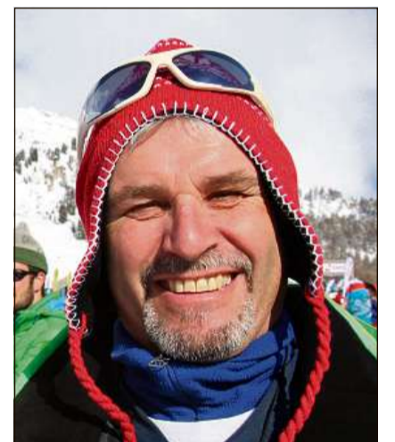
El ha ina capitscha sco ils sherpas.