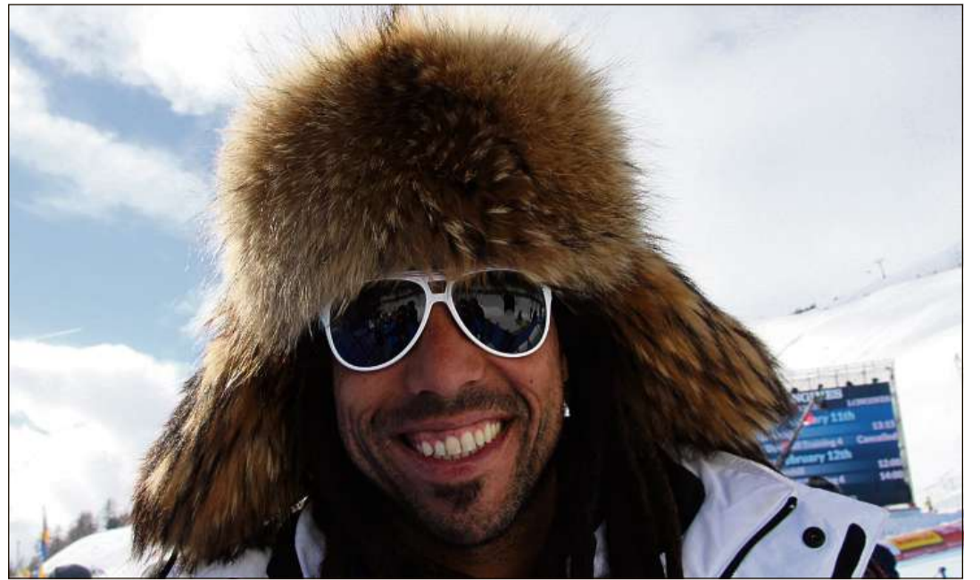
Da vesair a Salastrains a l'arrivada èn da tuttas chapitschas.