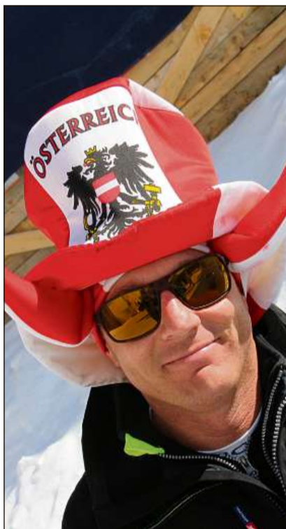
Quest fan è persuerter per l'Austria.

En egl è er crudà sonda la damaun baud ch'ils fans baivan strusch aua da la funtauna minerala da San Murezzan. Na, già bainbaud vegn bavì vin alv, café Luz e vin chaud. Quellas bavrondas èn sa chape-scha er in bun med cunter las temperaturs da vers minus sis grads e la chaschun per sa scaldar. Per avair chaud èn lura er las chapitschas ch'ils fans portan e quai tar mintga cursa ed er en vischnanca a San Murezzan. La fantasia dals fans tar la