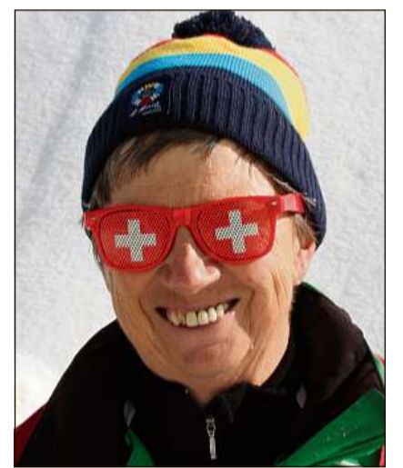
Schizunt eglers cun la vopna svizra.