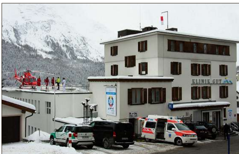
Da Salastrains han ins transportà Lara Gut cun l'helicopter en la clinica «Gut» suenter sia blessura.

la gi da perseguitar il slalom da la cumbinaziun avant la televisiu en sia suite da l'hotel Kempinski. Alamain ha Gut gi ina consolaziun cun procurar sias duas amias Wendy Holdener e Michelle Gisin per ina victoria dubla per la Svizra. Sin quella via bun meglierament a Lara Gut.